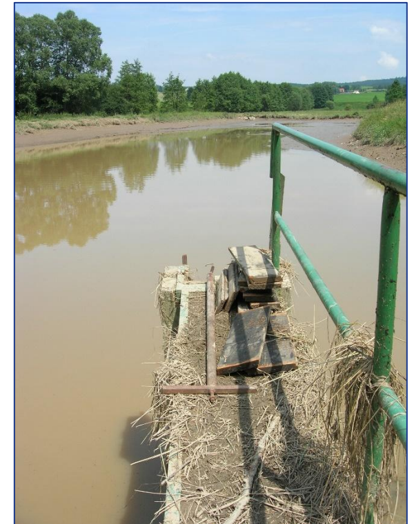
Bohunický rybník 2009