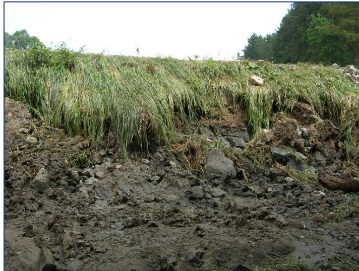
Bohunický rybník - hráz 2009