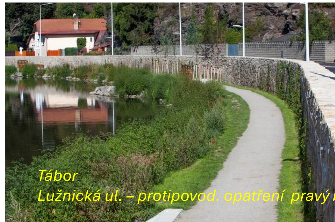
Tábor Lužnická ul. – protipovod. opatření pravý břeh

Povodňová opatření nejsou výstavba, údržba a opravy staveb a ostatních zařízení sloužících k ochraně před povodněmi, jakož i investice vyvolané povodněmi