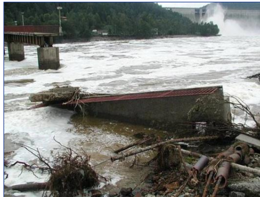
Pod VD Orlický 2002