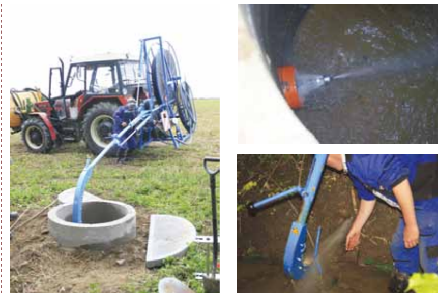
Obr. 2 Údržba drénů prováděná s využitím hydročističe (Foto: Z. Kulhavý).

Zaměříme se nyní na POZ, protože údržbu HOZ zajišťuje jeho správce a v případě odvodňovacích kanálů otevřených nebo zatrubněných ji provádí podle ČSN 75 4210. Způsob a rozsah péče uvádí Vyhláška č. 225/2002 Sb. Údržba POZ je prvotně zaměřena na zajištění průtočnosti drenážního potrubí, mělo by se však dbát i na zachování hydraulické spojitosti povrchu s drény i na dobrou propustnost přilehlého půdního profilu. Voda musí mít možnost do drénů vtékat. Tuto funkci zajišťuje především drenážní rýha, případně drenážní obsyp (pokud byla „opatření na drenáži“, zlepšující vlastnosti vtokové oblasti drénů, při výstavbě realizována). Funkčnost drenážní rýhy není možné obnovovat jednoduše a údržba se proto zaměřuje na celý půdní profil v celém areálu odvodnění. Pokud se v praxi vžil pro odvodnění termín „meliorace“, bylo to proto, že v rámci stavby odvodnění se meliorovaly (zlepšovaly) i fyzikální vlastnosti pozemku, které zároveň podporovaly odvádění vody ze zamokřené části pozemku. Záleželo na příčině zamokření, která byla, zjednodušeně řečeno, buď srážkovou vodou, infiltrující z povrchu, nebo podzemní vodou, přítékající k drénům zdola (viz Obr. 1). V rámci údržby (jako součást agrotechniky) je třeba rozbít nejen půdní škraloup, který omezuje infiltraci srážkové vody a zvyšuje podíl povrchové odtékající vody se všemi negativními efekty, ale také rozrušovat málo propustné půdní